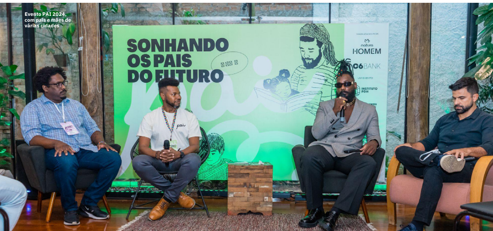
Evento PAI 2024, com pais e mães de várias cidades