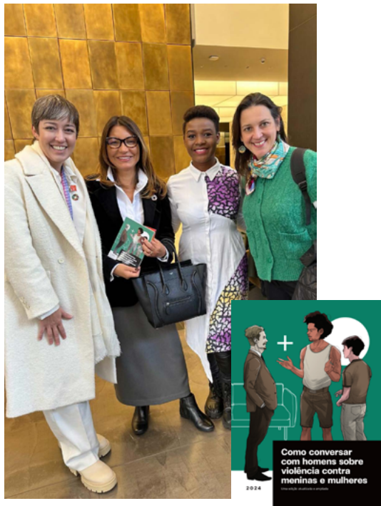
Livro: Como conversar com homens sobre violência contra meninas e mulheres, 2024