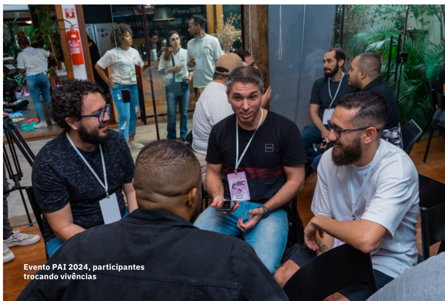
Evento PAI 2024, participantes trocando vivências