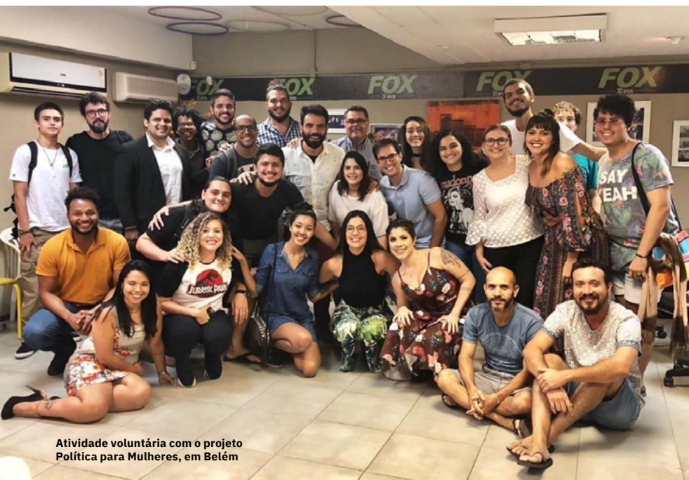
Atividade voluntária com o projeto Política para Mulheres, em Belém