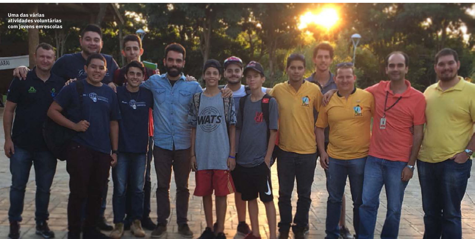
Uma das várias atividades voluntárias com jovens em escolas